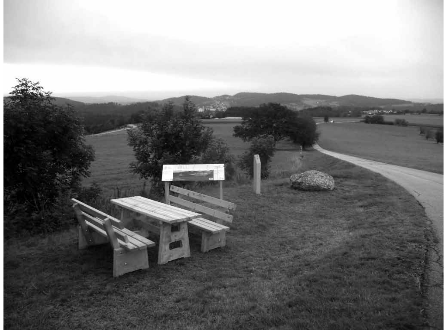
Kapelle) verlassen wir wieder den Kapellenweg und münden ein in die VIA NOVA. Wir treten den rund 3,5 Kilometer langen Rückweg in den Auenpark

Nach einer Rast beim dortigen VIA NOVA Sitzstein und hören des Audioguides geht es in die Ortsmitte von Kreuzberg zur St. Anna-Wallfahrtskirche. Ab hier folgen wir der Beschilderung des Kapellenweges „Weg der Besinnung“ und finden dazu neben der Kirche eine Gesamtübersichtstafel des 4 Kilometer langen Themenweges mit der ersten Station. Bei Station 7 (Kreuz-