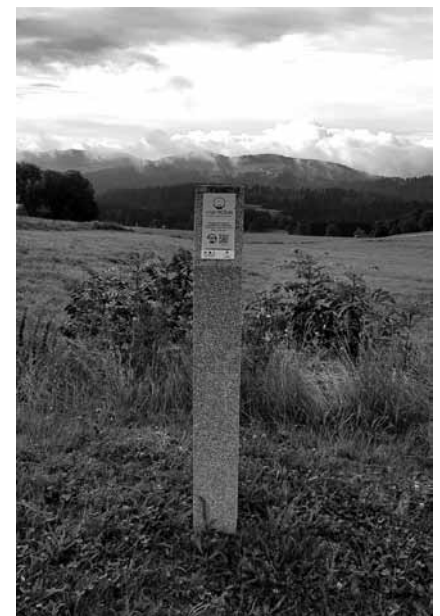
Kreuzberg – Anna-Wallfahrt und Weiter Blick