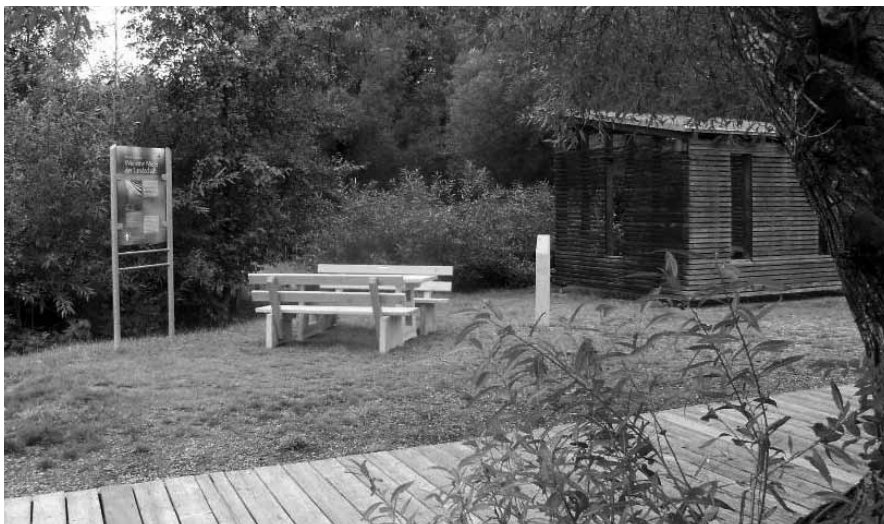
Rast im Auenpark

QR-Codes zum Anhören der zwei Freyunger Audioguide-Stationen: